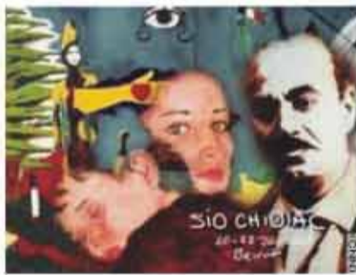
الجوع، كون اللوحات غير قابلة للأكل، الجديد